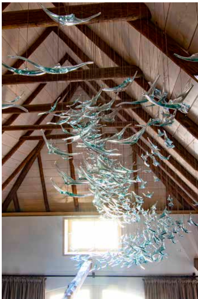
Rechts: Bibi Smit, Vogelvlucht , 2020; installatie, lengte 600 cm.