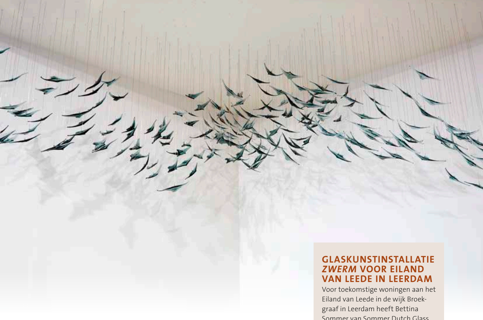
Bibi Smit, Zwerm , 2018. Vier nieuwe Zwermen komen in de wijk Broekgraaf in Leerdam