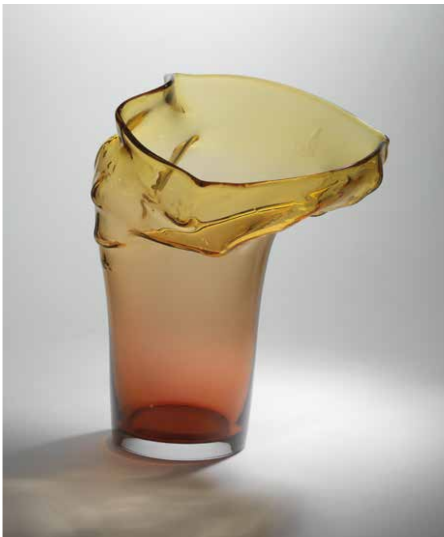
Bibi Smit, Verwaaide vaas , 2010; geblazen glas; h. 42 cm, Ø 36-26 cm.

Ze verdiepte zich drie jaar na het basisjaar in het glas. Ze werd assistent glasblazer bij onder anderen Willem Heesen in Glasstudio De Oude Horn in Acquoy (1987) en van 1988 tot 1989 ook bij Lindean Mill Glass in Galashiels in Schotland. Behalve